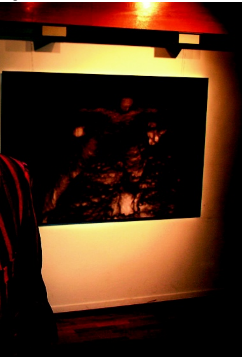
ingar. I år er 61-åringen debutant på Vestlandsutstillinga med fotografiet «Snølv».